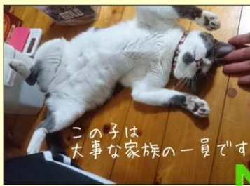
この子は 大事な家族の一員です