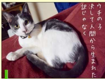
ウチの子 決して人間から生まれた 訳いなく