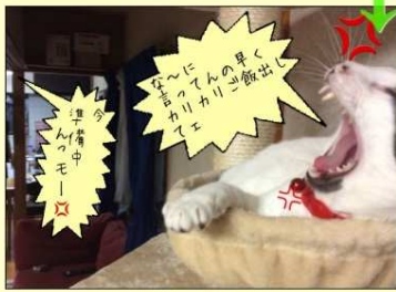
なんにょんの早くも 運命の瞬間！