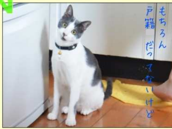
もちろん 戸籍 だつてないけど